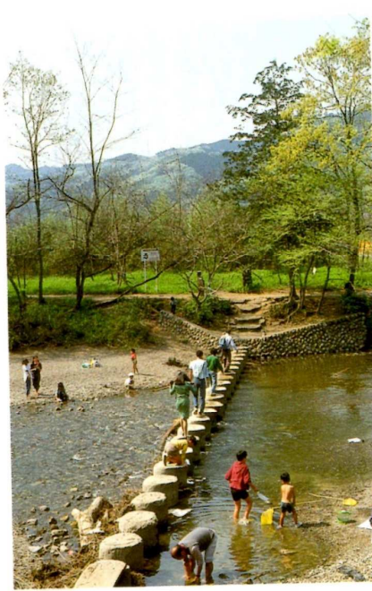
上/釣り船やボートの浮かぶ宮沢湖。観光地としても人気が高い。 左/高麗川に架かるドレミフア橋は子どもたちに喜ばれている。

ア橋で対岸に渡る。木造の休憩所から眺める巾着田を前景とした日和田山は堂々たる風格だ。広々とした湿原から狭い道路を抜ければ交通の激しい車道に出る。左に鹿台橋を渡り、信号を左折すれば高麗駅は近い。なお、本コースは、ゴルフ場や宅地の造成、巾着田の観光地化などにより、現況は著しく変わりつつある。(打田 鏡一)